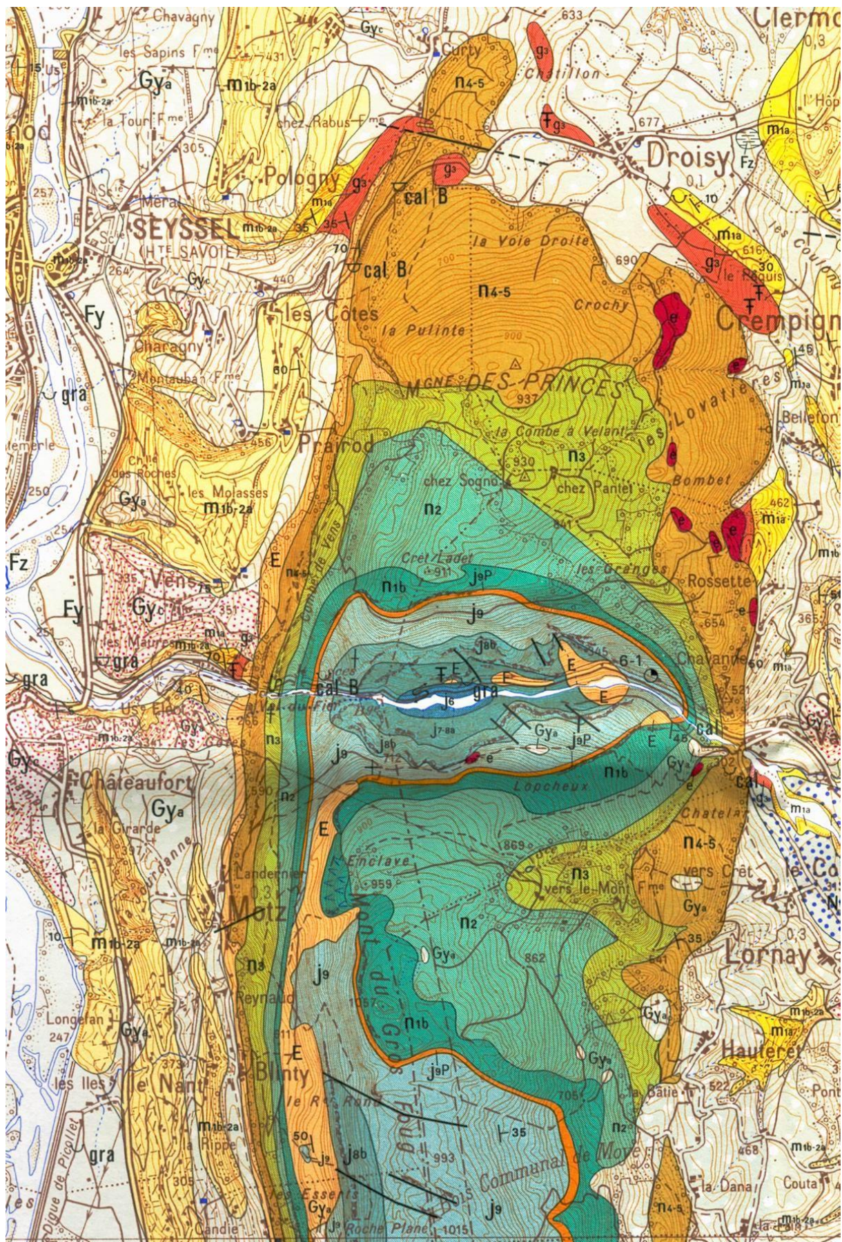
EXTRAIT CARTE SEYSSSEL (1/50000 emc )